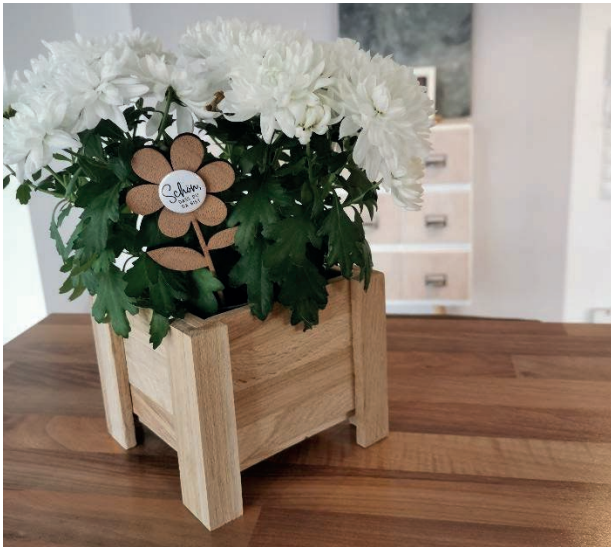
Holzkisten & Pflanzkübel